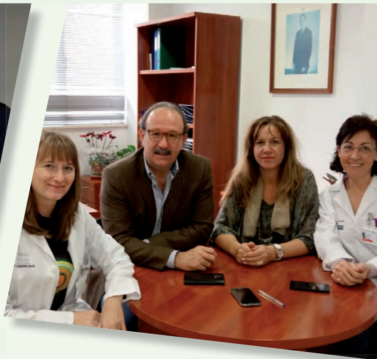
DPTO. SALUD MARINA BAIXA