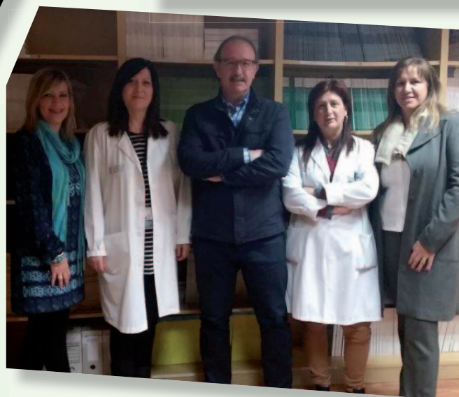
DPTO. SALUD ALCOY