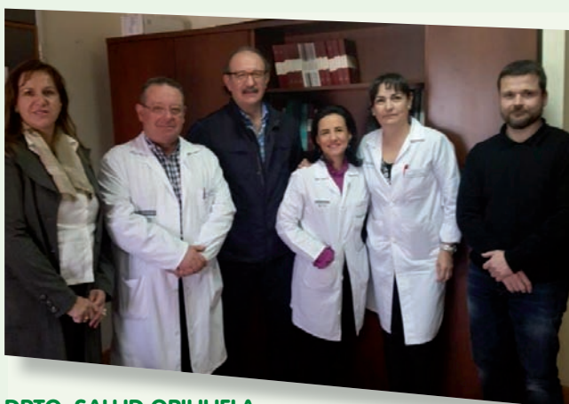
DPTO. SALUD ORIHUELA