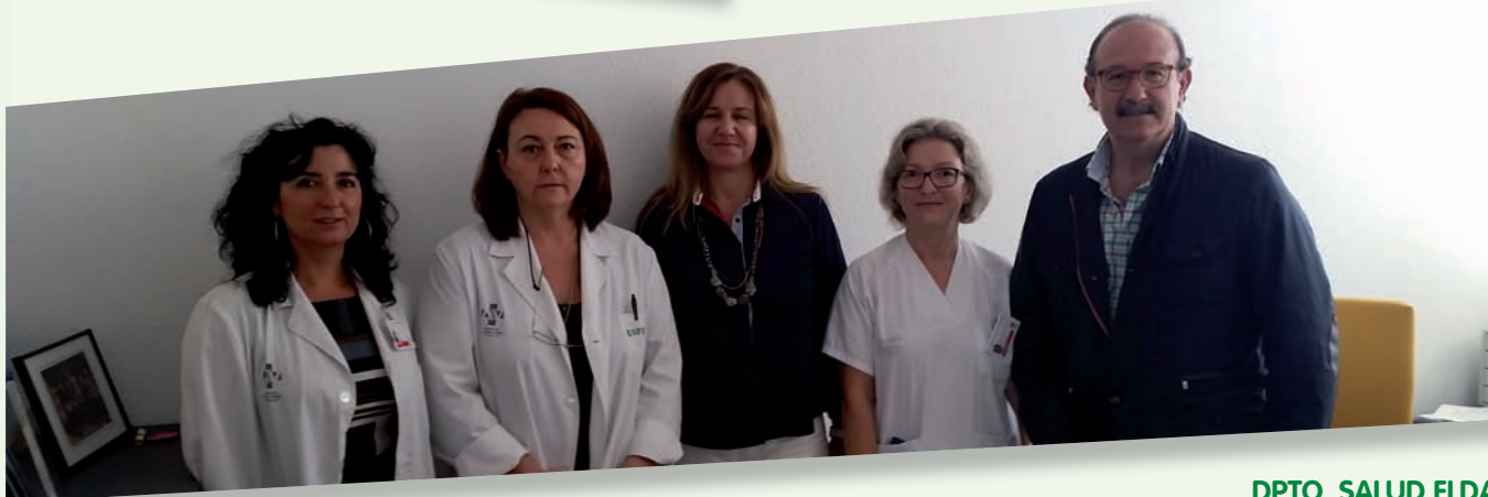
DPTO. SALUD ELDA