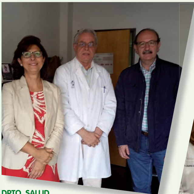
DPTO. SALUD ALICANTE - HOSPITAL GENERAL

Junto a estas líneas reproducimos tanto las imágenes de estas tres últimas reuniones en Alcoy, Villajoyosa y Orihuela como las mantenidas también con los responsables de Enfermería de los hospitales de Alicante, San Juan, Elche y Elda de las que ya se informó en una anterior circular informativa.